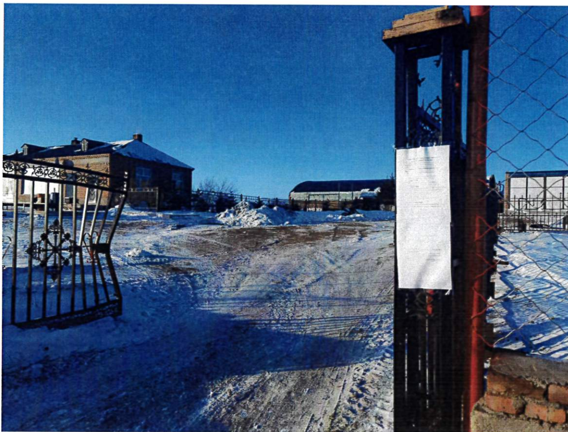
图 5 2023 年 12 月 21 日张贴公示图

于知悉的场所张贴公告的方式公开，且持续公开期限不得少于 10 个工作日”的要求，张贴照片见图 5，张贴内容见附件 2。