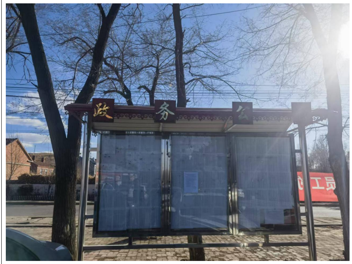
图 3-4 现场张贴公示照片