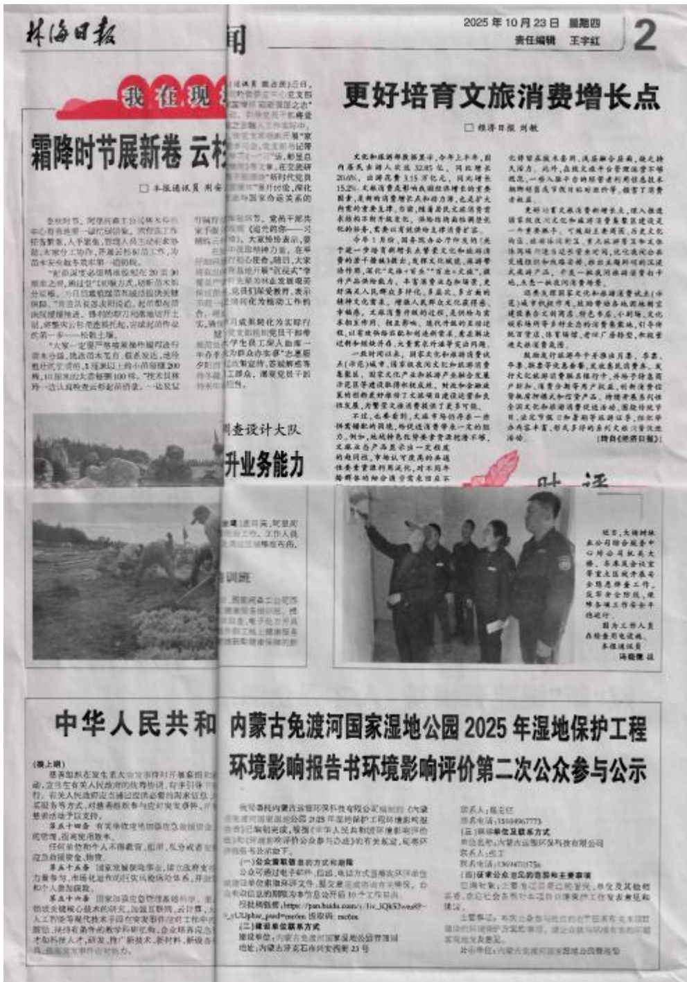
图5 2025年10月23日二次信息公告登报