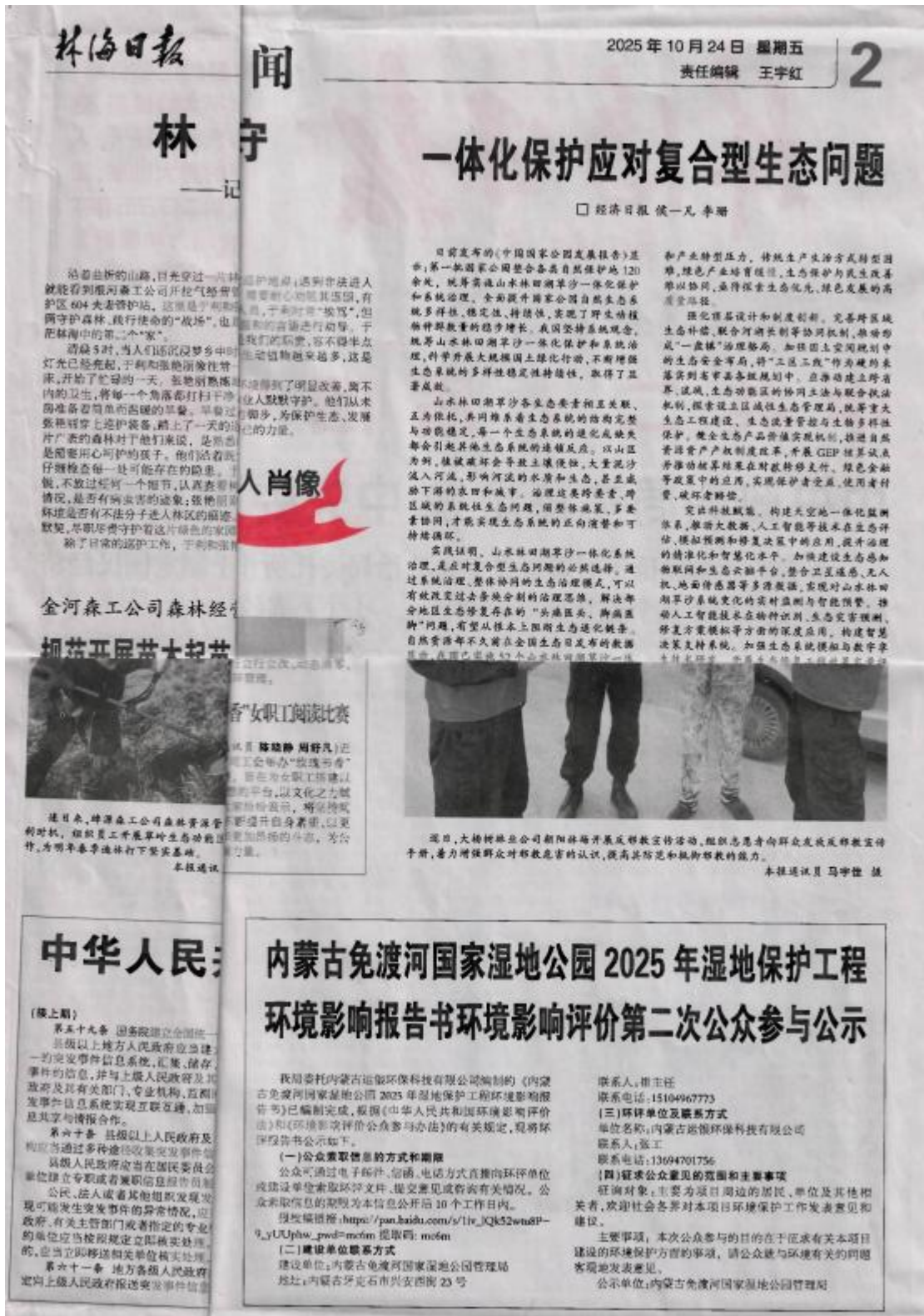
图4 2025年10月24日二次信息公告登报