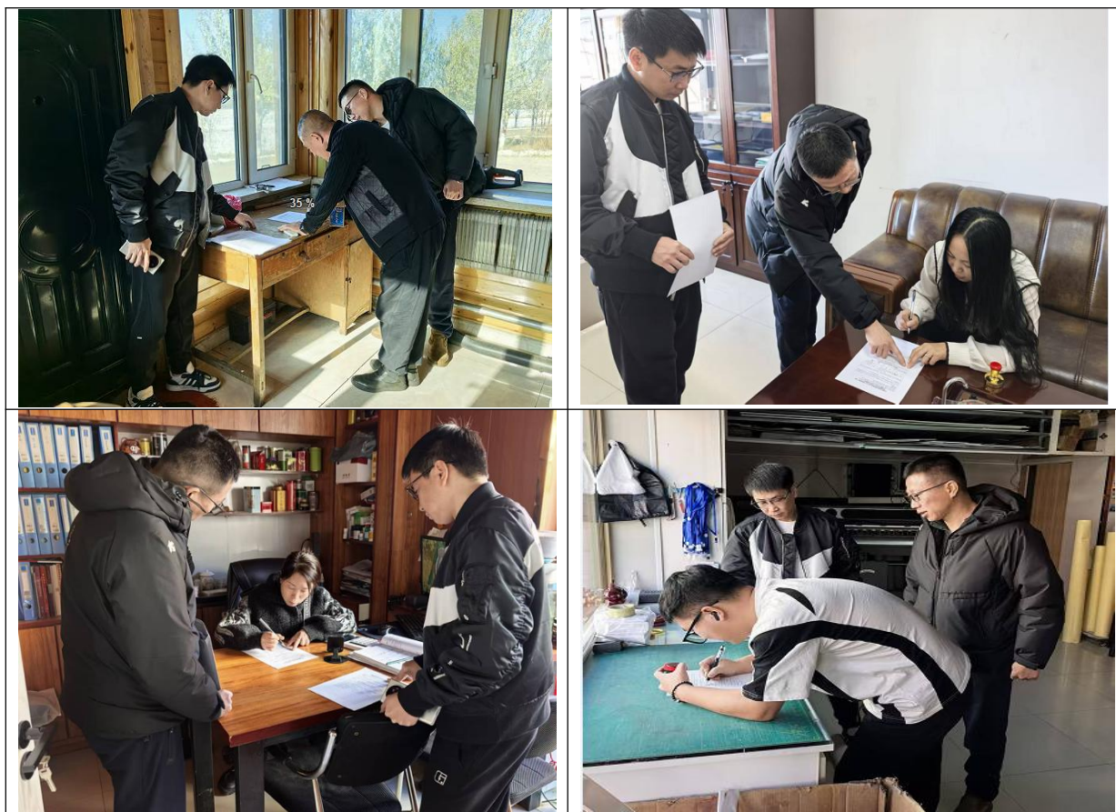
图2 问卷调查现场图片