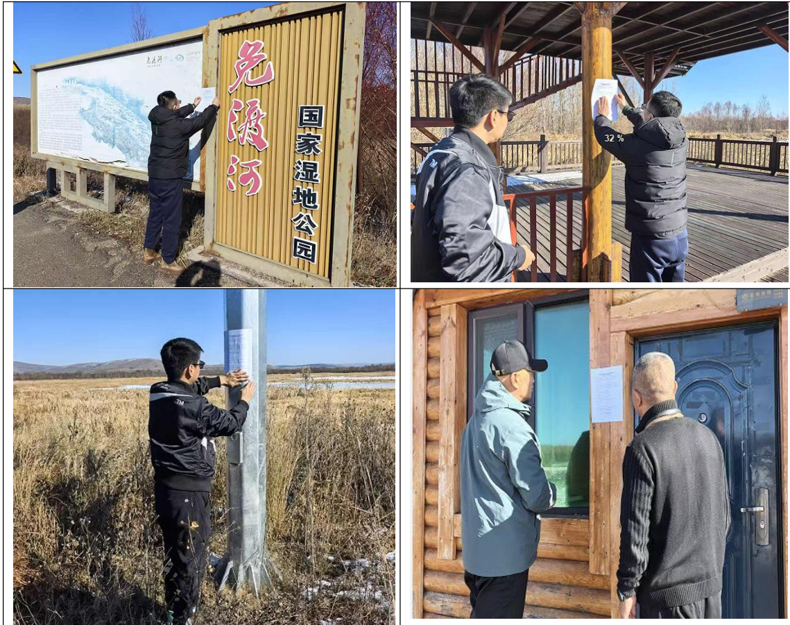
图1 公众参与第一次信息公告张贴公示

网络公开选择的载体、公示内容、格式和公开时间均符合《环境影响评价公众参与办法》的相关要求，第一次信息公告网络公示截图见图 1。