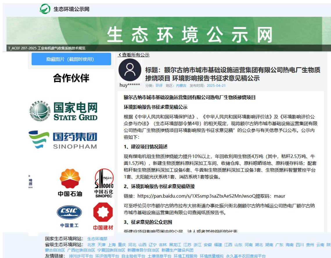
图2 征求意见稿、公众参与调查表网上公示截图

本项目环境影响报告书征求意见稿、建设项目环境影响评价公众意见表首先采用网络的方式进行。