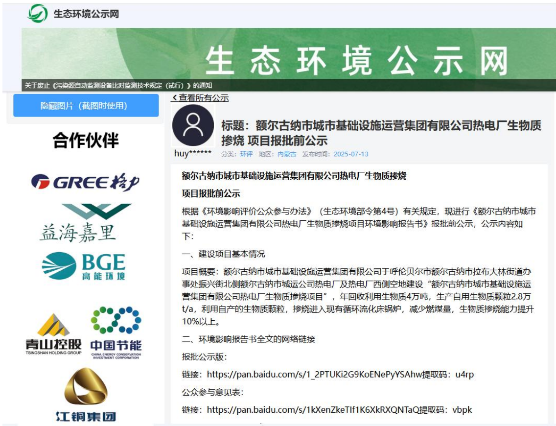
图 4 报批前公示截图

额尔古纳市城市基础设施运营集团有限公司于 2025 年 7 月 13 日，本项目报批前在生态环境公示网网站进行了报批前公示。