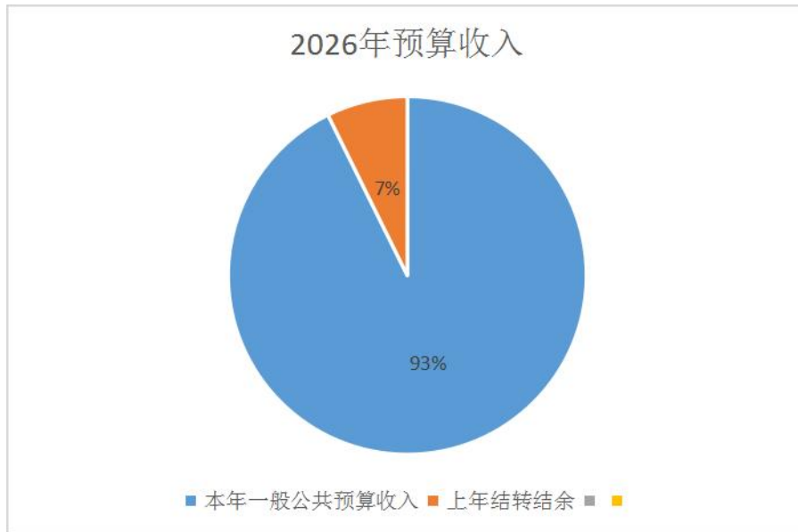
图 1. 收入预算图