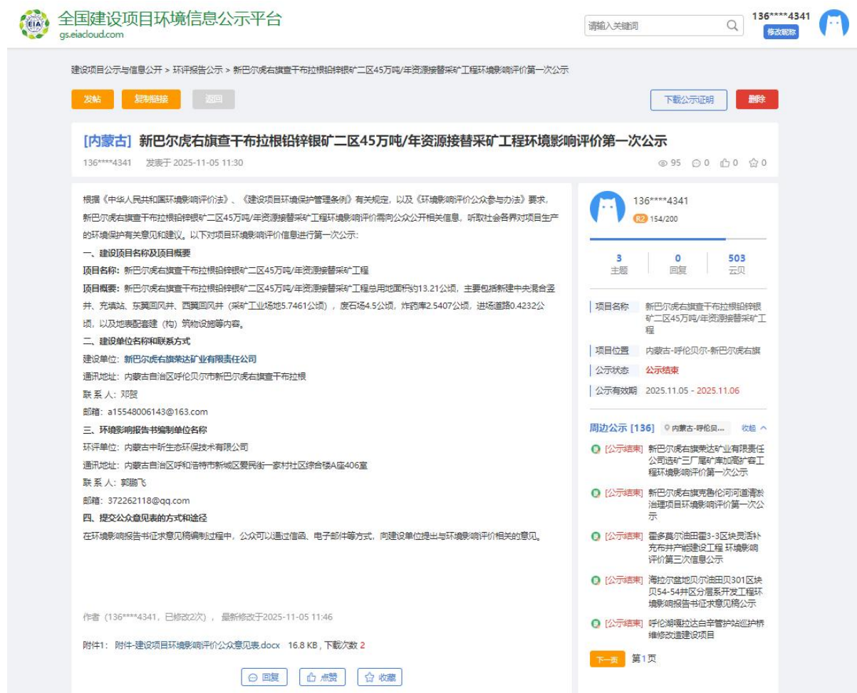
图 2.1 第一次公示网站截图