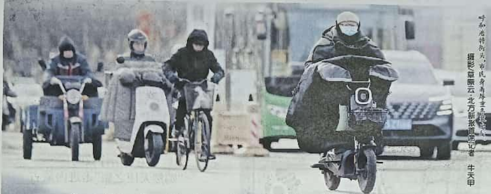
呼和浩特市街头，市民身穿厚冬装骑行。摄影/卓原云 北方新报记者 牛天甲