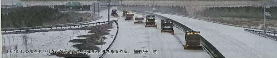
1月18日，公路养护部门在呼和浩特周边公路开展除雪作业。