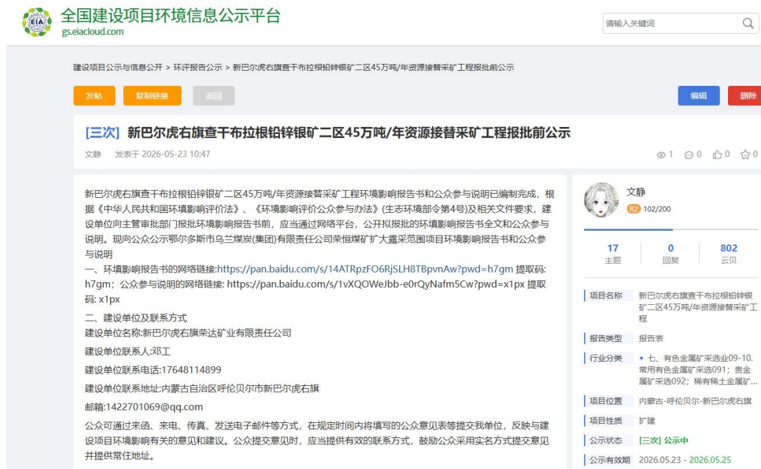
图5.1 报批前公示截图